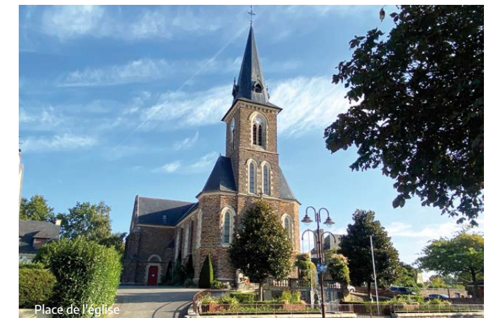
Place de l'église