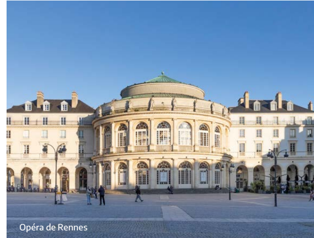
Opéra de Rennes

2 e MÉTROPOLE FRANÇAISE LA PLUS ATTRACTIVE (Hellowork 2022)