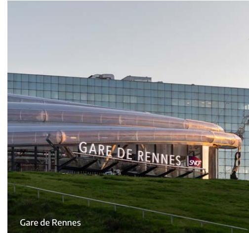
Gare de Rennes