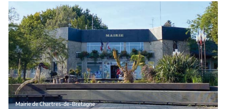
Mairie de Chartres-de-Bretagne