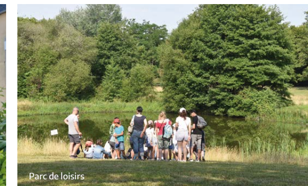
Parc de loisirs